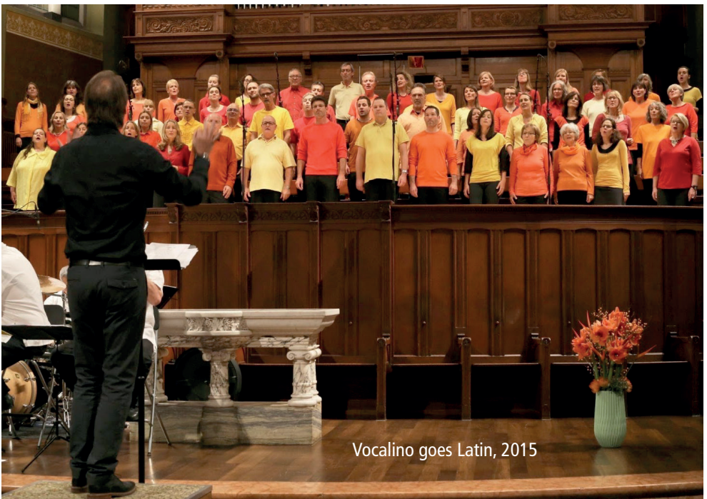
Vocalino goes Latin, 2015

Als Gönnerin oder Gönner unterstützen Sie den Vocalino-Chor finanziell, ohne Mitglied zu sein. Ab 150 Franken pro Jahr (Betrag frei wählbar) sind Sie dabei und erhalten als Dankeschön ein Freibillet für unser Jahreskonzert. Auf Wunsch erwähnen wir Sie gerne im Programmheft und auf