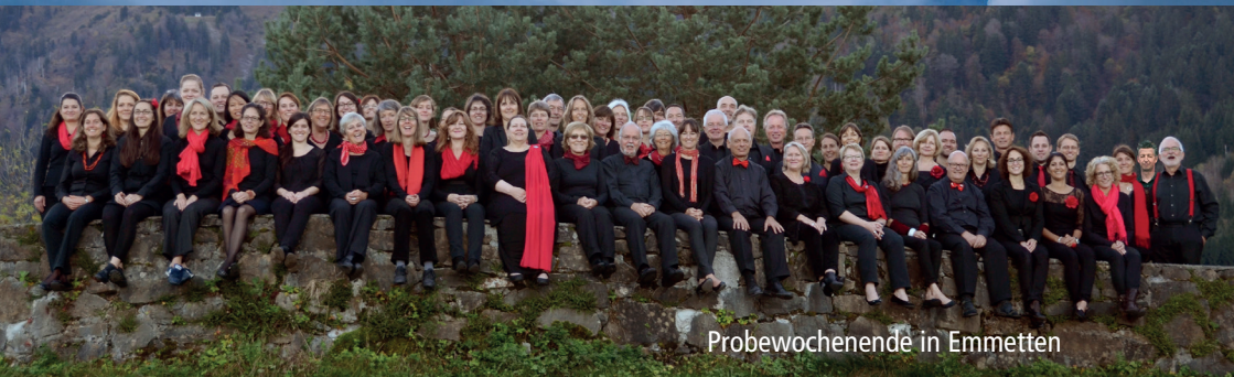
Probewochenende in Emmetten

Jetzt ist der ideale Zeitpunkt, um für das neue Projekt einzusteigen. Wir proben jeweils am Donnerstag von 19.40 – 21.30 Uhr in der Aula der Kantonsschule Zürich-Enge. Weitere Informationen und Anmeldung zur Schnupperprobe unter www.vocalino.com oder über info@vocalino.com . Wir freuen uns auf Sie!