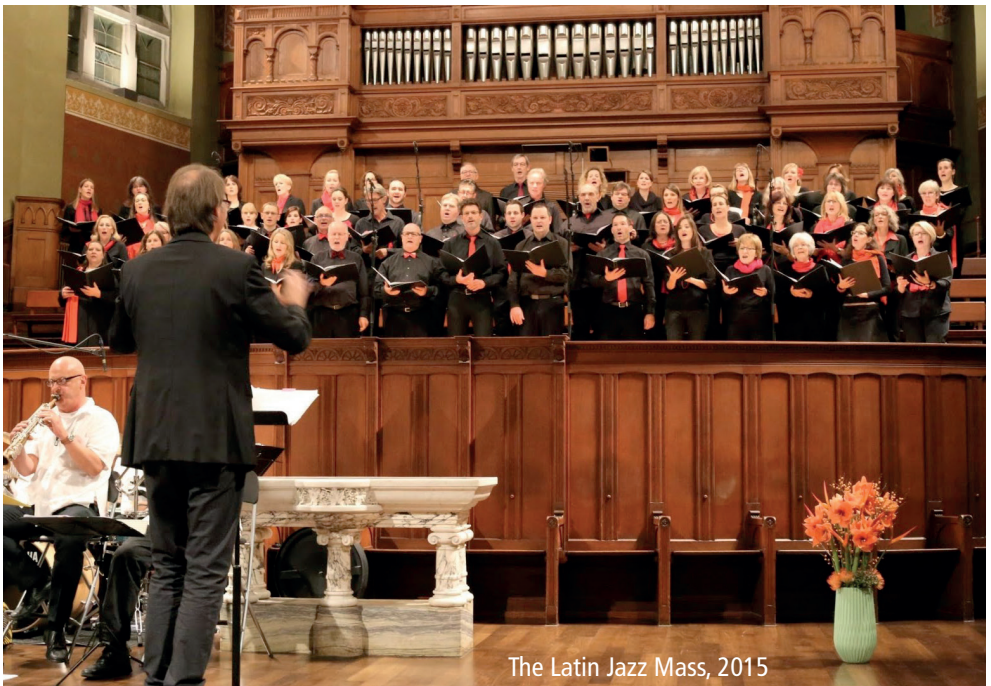
The Latin Jazz Mass, 2015